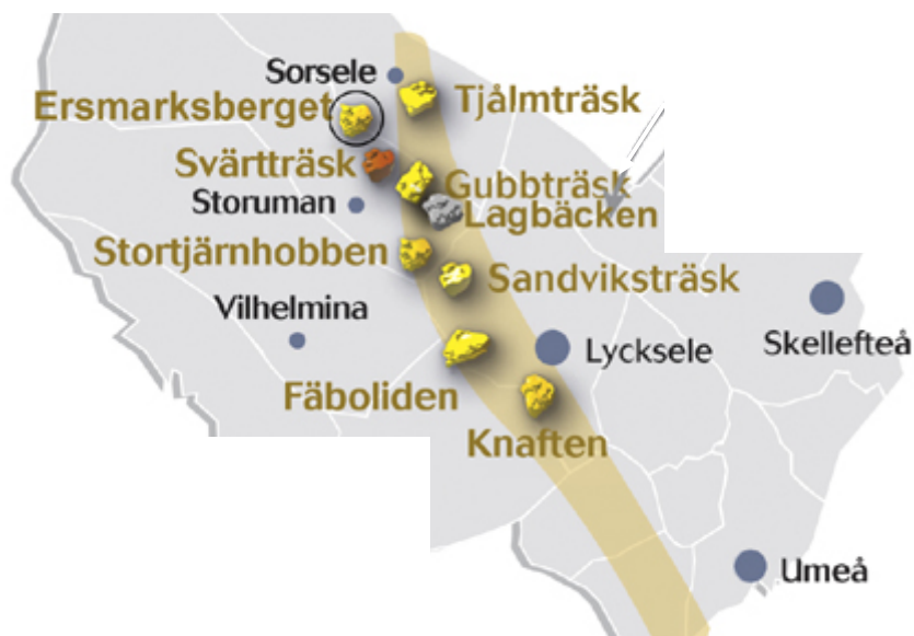
Figur 3: Forekomster i "gull-linjen" (fra Lapland Goldminers web side – se over)

( http://www.botniaexploration.com/projekt/projektbeskrivningar/vargbacken-k-nr-1-2010-03-22 ) Forekomsten har 1,2 Mt (indikerte) med 1,44 g/t Au og 0,9 Mt (antatt), med 1,44 g/t Au. Det er innvilget konsesjon for prøvebryting av 65 000 t malm.