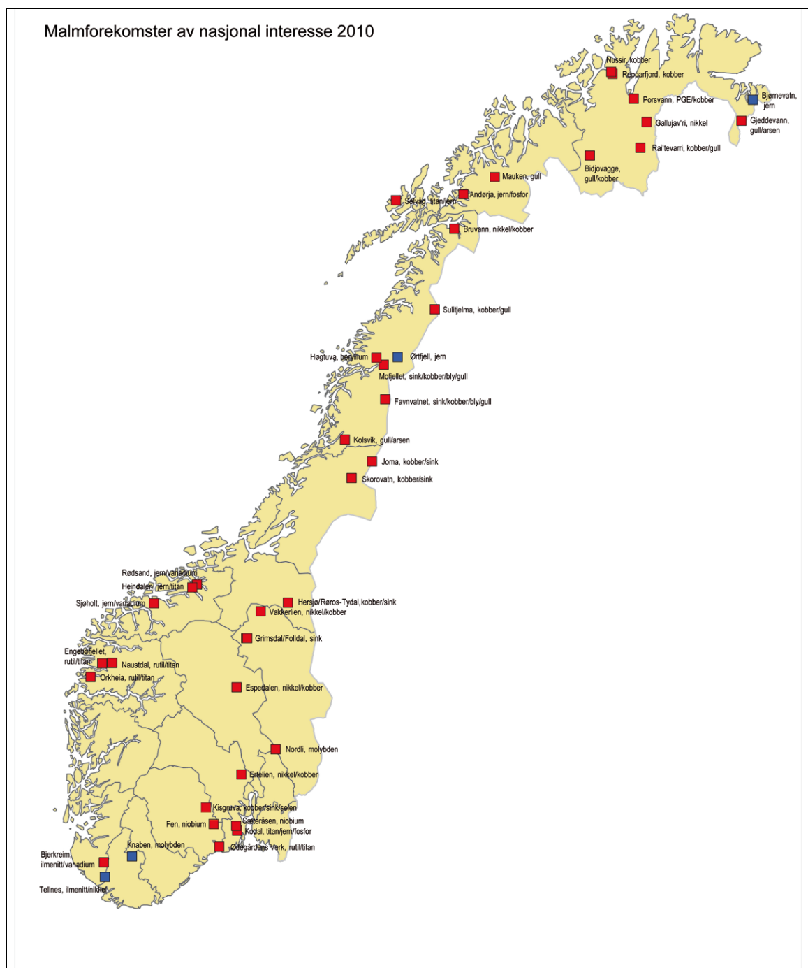
Figur 1: Malmforekomster av nasjonal interesse 2010 (NGU og Direktoratet for Mineralforvaltning, 2011) (Blå symbol – i drift, rød symbol – ikke i drift)

Den eneste produksjon av edelmetaller i Norge pr. november 2011 er Xstratas raffinering av gull, platina og palladium som biprodukt ved nikkel raffineriet ved Kristiansand. Selskapets webside oppgir tall for produksjon av nikkel, kobber og kobolt, men ikke for edelmetallene. Xstratas råstoff kommer fra flere gruver i Kanada hvor malmen har varierende kjemi slik at det