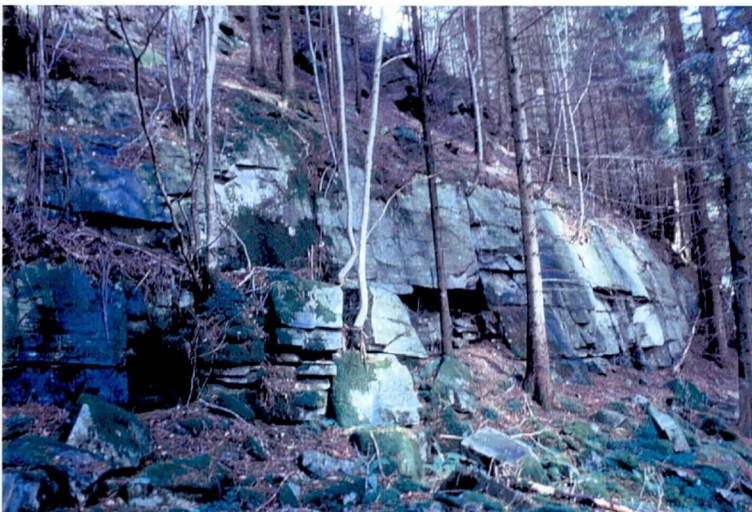
Figur 5 Skrent med kvartsrik gneis fra område 1 i figur 3. merk gunstig 'lagning' (kløv) og rytmiske vertikale sprekker.

Av disse områdene er nr. 1 klart det største og trolig beste uttaksstedet (figur 5). Forsiktig regnet finnes ca. 400 000 tonn tilgjengelig volum stein. Det vil videre være ganske lett å få til adkomst direkte fra hovedvegen.