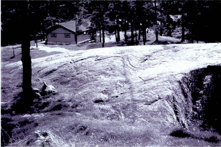
Figur 4 'Overgangssone' mellom glimmerskifer og kvartsrik gneis kjennetegnes av å ha ugunstig oppsprekning og dårlig kløv grunnet folding, som vist på bildet.