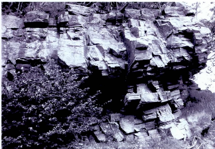
Figur 6 Detalj fra område 3 i figur 3. Merk gunstig 'lagning' (kløv) og liten avstand mellom vertikale sprekker.

Det kan videre ikke utelukkes at det også mellom disse områdene innenfor sonen med kvartsrik gneis kan forekomme kvaliteter som er anvendelige til formålet, om ikke optimale.