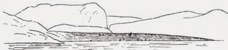
Løsterrænet ved Fossan kirke.

Naar man med dampskibet har dreiet ind i Lysefjordens munding, viser det af løsmateriale bestaaende nes, hvorpaa Fossan kirke staar, sig som paa nedenstaaende tegning fremstillet. I baggrunden i billedets venstre halvdel hæver sig Uburfjeldet, som har en meget steil styrtning ned mod Hølefjord. Bergarterne i denne egn tilhører grundfjeldets. Kirken ligger omtrent 30 m. o. h. Den og de fleste af de nærliggende