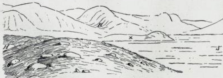
Vasryggen, den gamle moræne, der først erkjendtes som saadan i Nord-Europa.