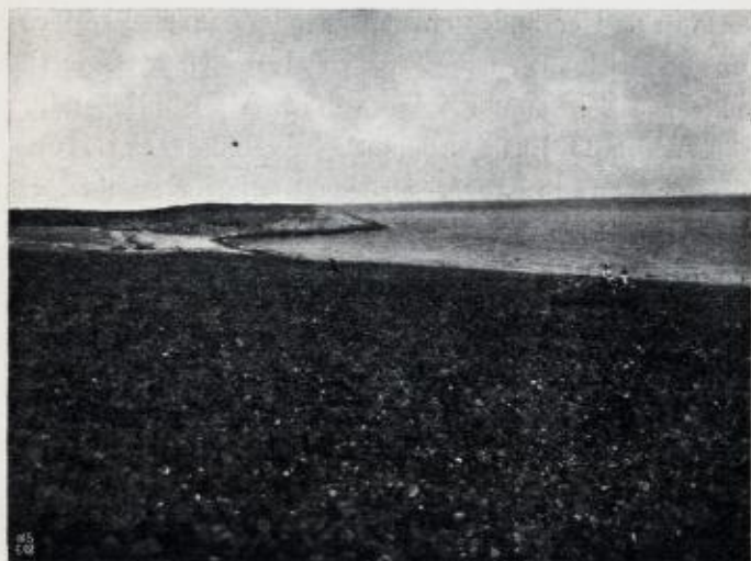
Fig. 2. Fra Tromsøens utside. „Raet.“ Fast fjeld stikker frem tilhoire paa billedet. Ser mot øst.

hvis prægtige stammer trækker næring fra det gamle istid-grus, mens de ytterste utløpere, som ikke har saa dyp jord, og kjæmper haardt mot de ublide elementer, staar med krokete rygger mot havblæsten og klorer sig fast i bergsprækkene og de karrige rester av løsmateriale som