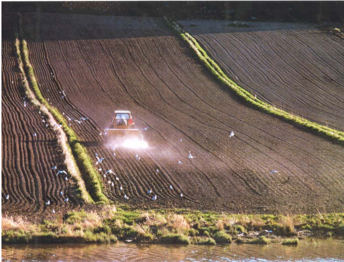
Figur 3 Jord utenfor tettbygd strøk er dominert av naturlige jordarter