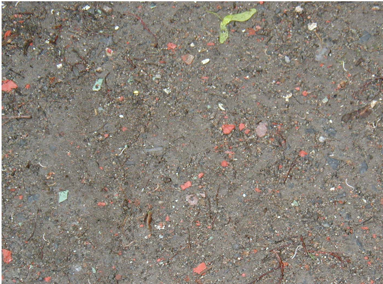
Figur 2 Jord med et stort innslag av antropogene partikler (teglstein, asfalt, malingsflak) fra bysentrum – såkalt byjord.

Innholdet av arsen, metaller og organiske miljøgifter har meget stor spredning. Medianverdiene for As, Cd, Cr, Cu, Hg, Ni, Pb, Zn, PCB sum7 , PAH sum16 og Benzo(a)pyren er alle lavere enn forslag til reviderte normverdier (Tabell 25).