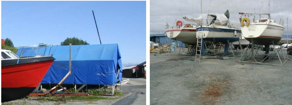
Figur 2. Pussing med telt (t.v.) og uten (t.h). Det er fare for spredning til et større område

Bruk av maling, bunnstoff og impregnering er ikke til å unngå ved småbåthavnene. Det er imidlertid viktig at det brukes godkjente stoffer som ikke vil utgjøre noen miljø- eller helseisiko. I mange av havnene brukes telt eller presenning rundt båtene under pussing. Det er i etterkant av slikt arbeid viktig å samle opp malingsrester og eventuell forurenset jord og levere dette til godkjent mottak. Ved åpen pussing er det stor sjanse for at forurensninger spres til et større område, se Figur 2.