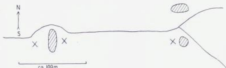
Fig. 1. Kartskisse av kaolinforekomsten ved Damtjernbekken. Skravert er blotninger av hornfels og kontaktmarmor, kryss viser steder hvor kaolinprøver ble tatt.

Sketch map of the kaolinite occurrence at Damtjernbekken. Oblique lines: exposures of rock (hornfels), crosses indicate localities of samples of kaolinite.