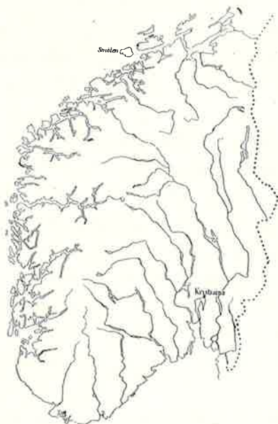
Outline map of southern Norway showing the location of the Island of Smölen.

In the following the author describes a few fossils from a limestone of a somewhat crystalline character, from the island of Smölen (see the map). Fossils are very rarely